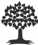
SV Reuth e.V.