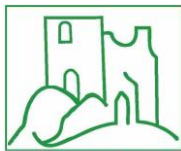
Gebiet um den Burgstein